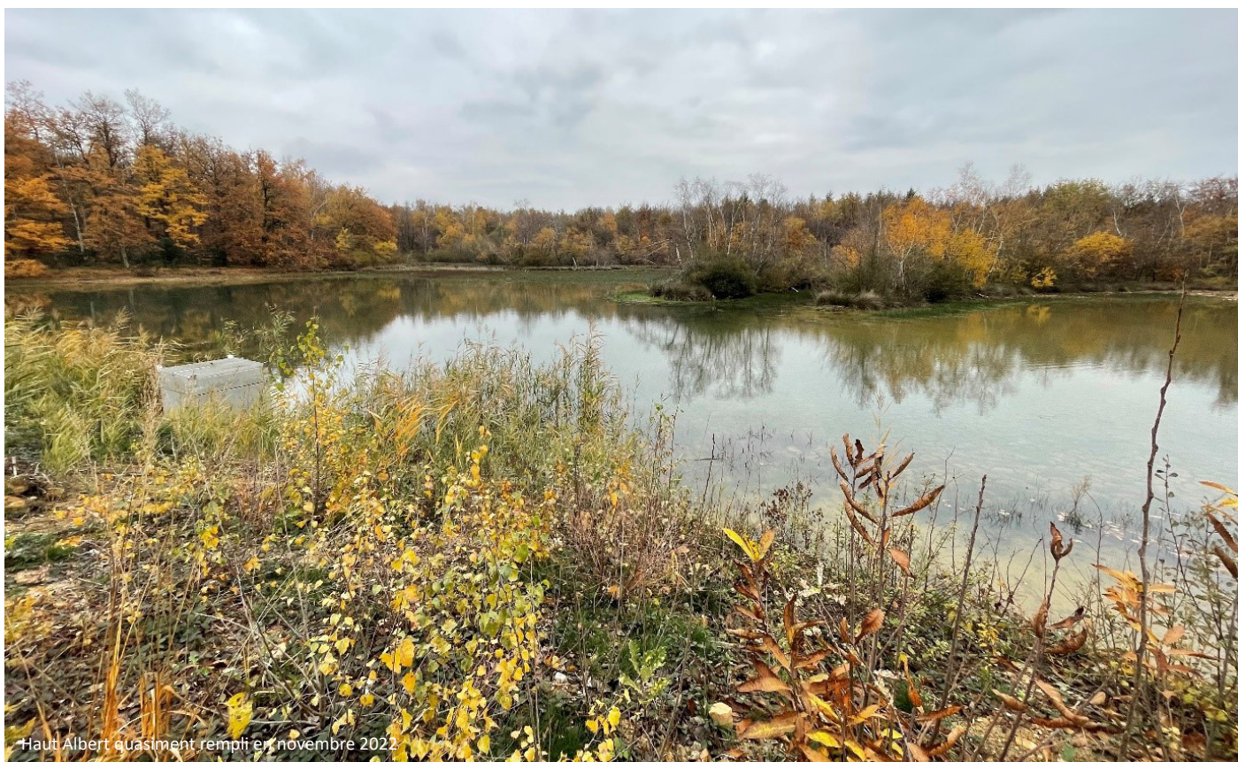
Haut Albert quasiment rempli en novembre 2022