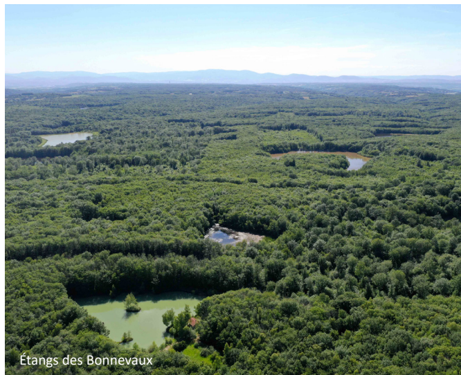
Étangs des Bonnevaux

” Parmi eux, l'étang du Grand Albert est le plus grand étang forestier du département de l'Isère (environ 17 hectares) et l'étang du Petit Coquet (1 hectare) est connu comme étant le plus riche du massif du point de vue des espèces patrimoniales présentes. ”