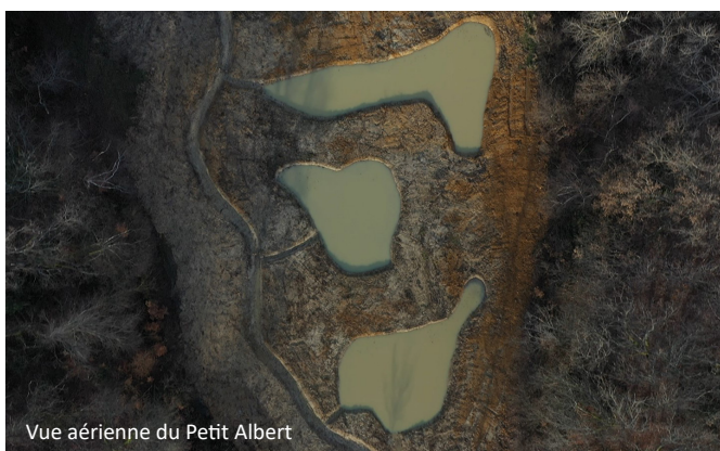
Vue aérienne du Petit Albert

Les travaux ont été réalisés par l'entreprise SARL Guillaud et les études techniques par Progéo Environnement, sous la conduite de la Délégation territoriale Isère de la LPO AuRA.