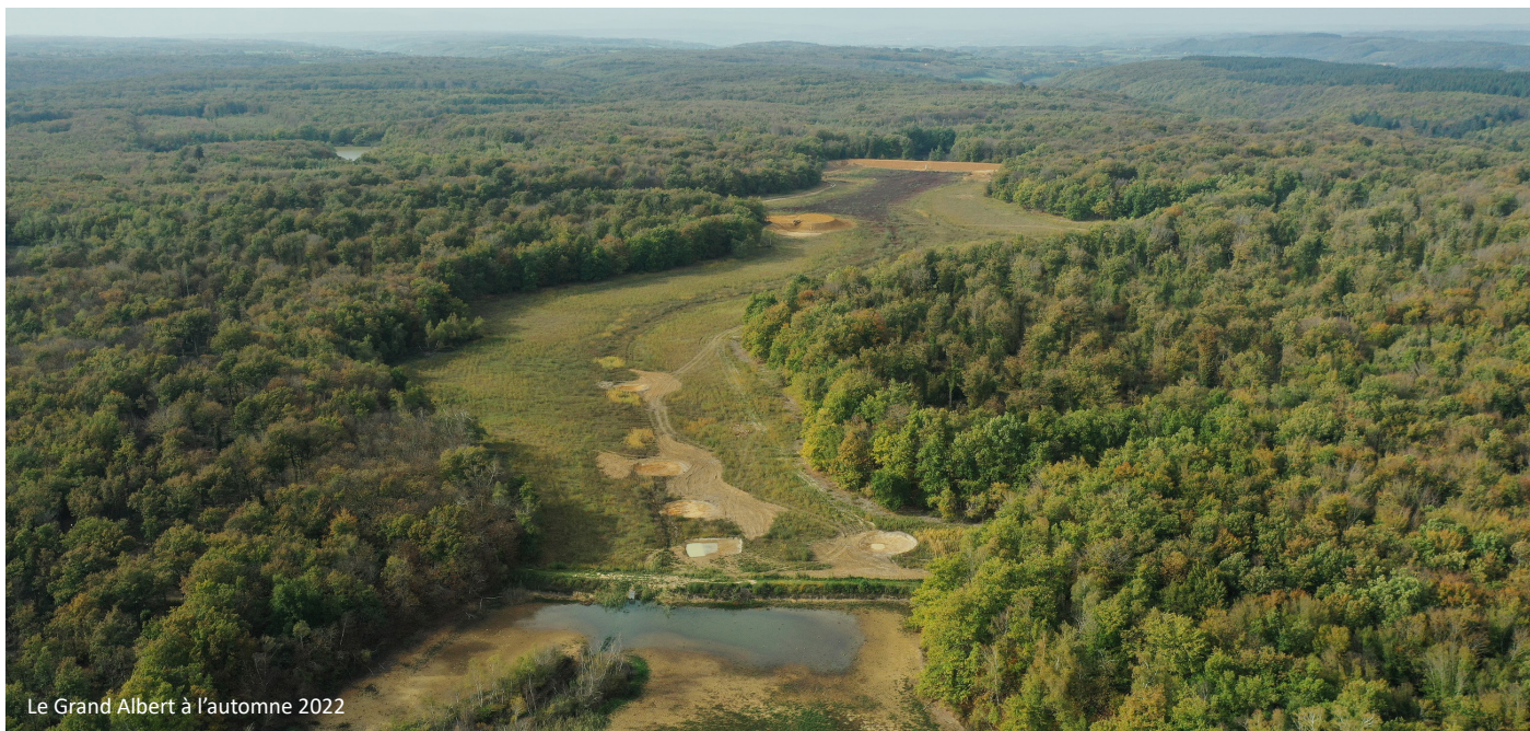
Le Grand Albert à l'automne 2022

Enfin, les derniers travaux effectués correspondent à la transformation du Petit Albert (ancienne pêcherie) en zone humide variée abritant 4 mares et un cours d'eau d'environ 90 m de long avec des légers méandres.