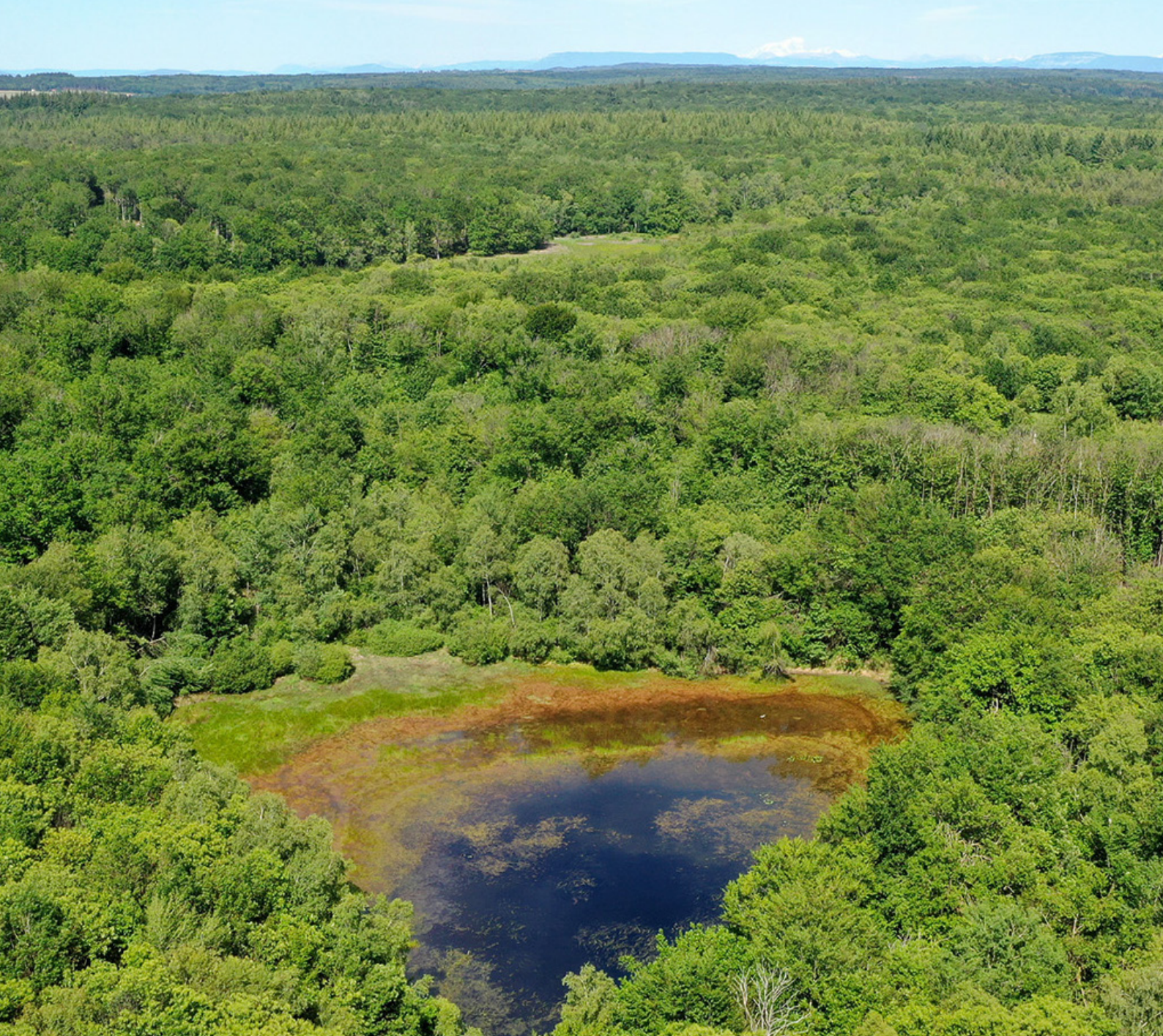
Étang du Petit Coquet

CONTACT Jean-Baptiste Decotte Chef de projet LPO jean-baptiste.decotte@lpo.fr 07 67 20 28 90