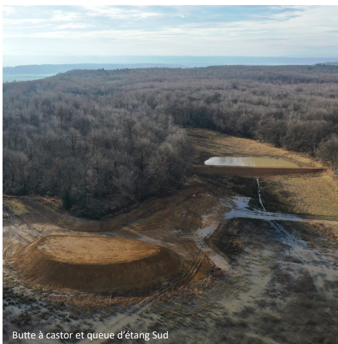
Butte à castor et queue d'étang Sud

La grande digue a quant à elle été finalisée en décembre 2022 avec la création de l'ouvrage de surverse et la finalisation du moine de gestion des eaux (sondes d'analyses, tuyau spécifique à la gestion du débit réservé à restituer en aval, etc.). La grande digue sera végétalisée au printemps 2023 par la réalisation de semis à la volée avec des graines issues du label végétal local.