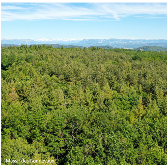
Massif des Bonnevaux

Ce projet bénéficie du soutien du « Collectif Grand Albert » qui regroupe plusieurs associations de protection de la nature et des particuliers engagés dans ce projet de renaturation