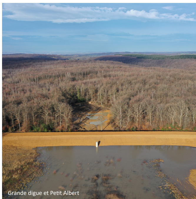
Grande digue et Petit Albert