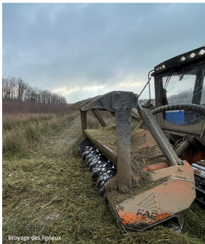
Broyage des ligneux

Avant tout chose, il était nécessaire de préparer le site pour pouvoir y conduire les travaux de terrassement de grande ampleur et permettre à l'étang du Grand Albert de retrouver son espace lorsqu'il sera rempli. Les ligneux ayant poussé dans l'étang depuis plusieurs années ont ainsi été broyés début janvier 2022.