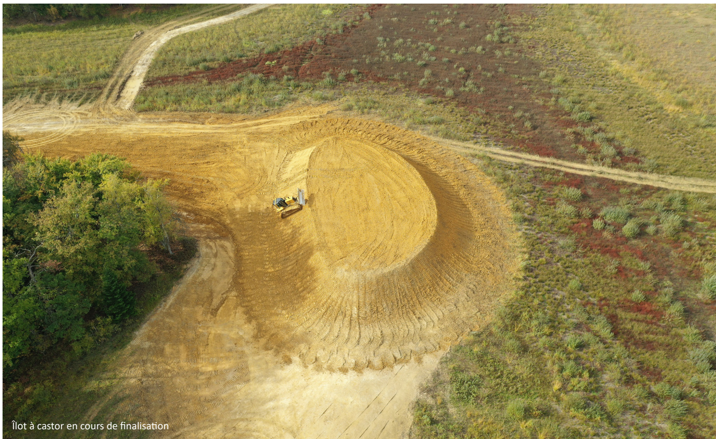
Îlot à castor en cours de finalisation

Un îlot dédié à l'accueil du castor a été créé au milieu de l'étang avec des pentes et une hauteur de talus au-dessus du niveau d'eau favorables à ce dernier.