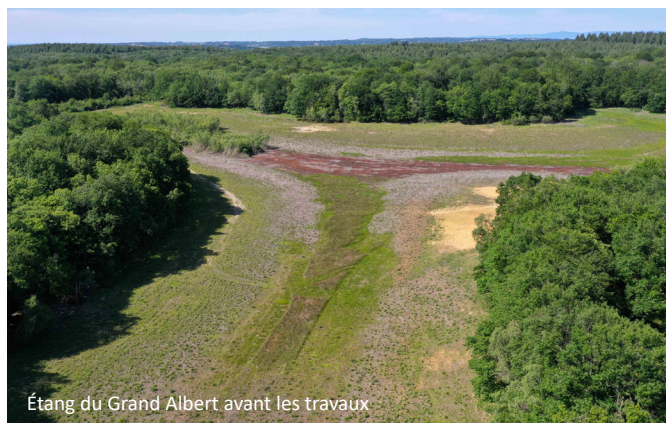
Étang du Grand Albert avant les travaux