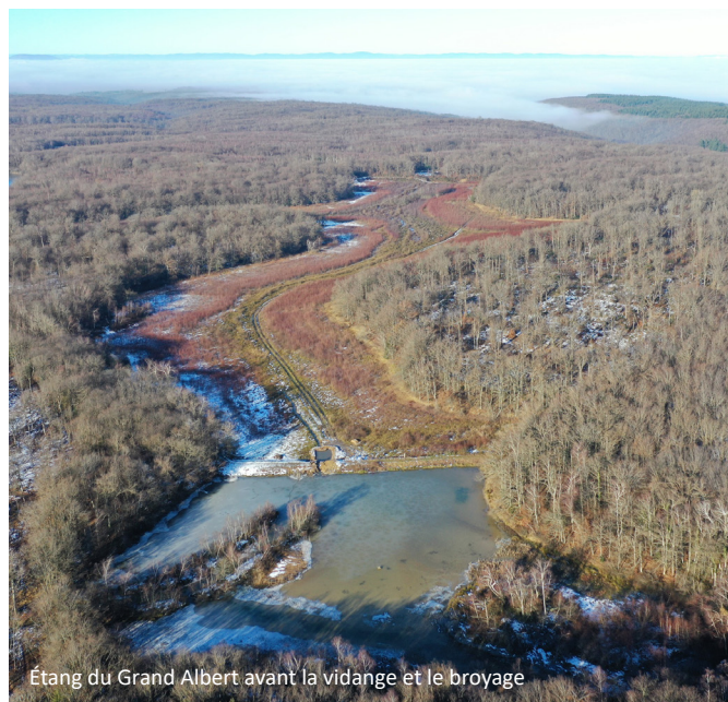
Étang du Grand Albert avant la vidange et le broyage

La LPO AuRA et la SCI Réserve Naturelle du Grand Albert remercient chaleureusement l'ensemble des donateurs sans qui ce projet n'aurait pu être réalisé.